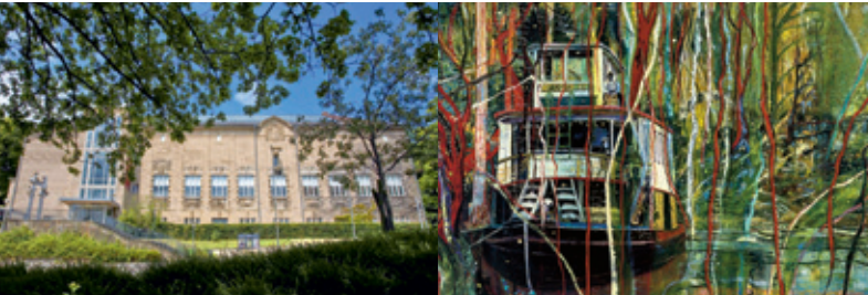
© v.l. n. r.: Foto: Martin Frommhagen, Kiel; Gemälde: Peter Doig, Okahumkee (Some other Peoples' Blues), 1990, Öl auf Leinwand